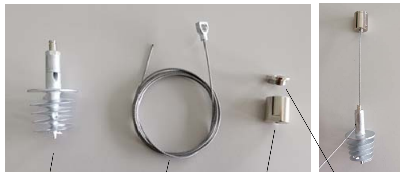
Stockschraube mit integriertem Seil-Schnellversteller Stair bolt with rope-quick adjuster

Use the integrated rope-quick adjuster of the stair bolt to revise the suspension height.