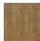
Bamboo dunkel | Regelmäßig gelocht / Bamboo dark | Regular perforated. . . . . 3

* abhängig von Abmessung, Dessin, System, Rohdecke und sonstigen Zusatzmaßnahmen / dependent on dimension, design, system, soffit and other project specific factors Die genauen Produkteigenschaften entnehmen Sie bitte den folgenden Seiten. / Detailed product features can be found on the following pages.